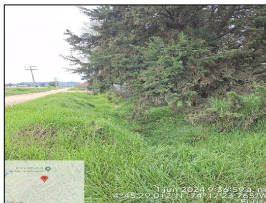
Ilustración 2. Evidencias del recorrido.